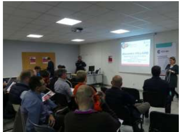
RLE Dombes Val de Saône mai 2019