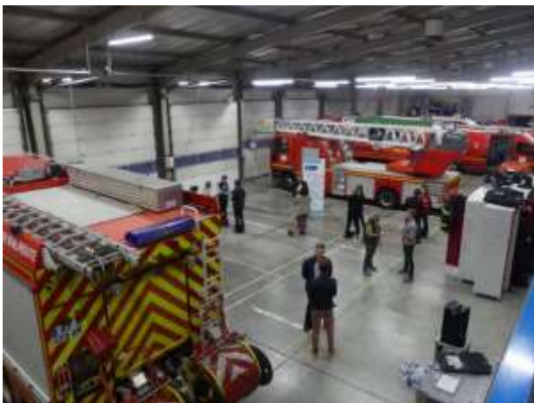
RLE Valserine octobre 2019